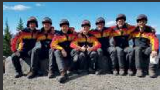
Team Deutschland in voller Pfanner Schutzbekleidungs Montur